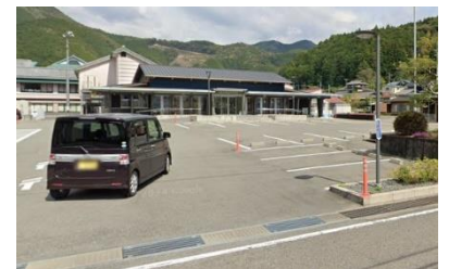
役場美山支所の駐車場