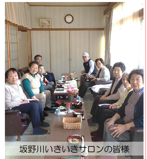
坂野川いきいきサロンの皆様